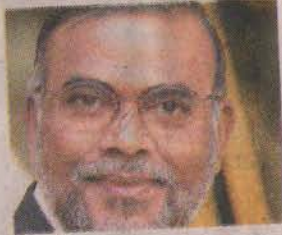
डॉ. नरेंद्र जाधव

नागपूर, ता. ११ : देशात गुणवत्तापूर्ण उच्चशिक्षणाची गरज असताना विद्यापीठ अनुदान आयोग, एआयसीटीई, एनसीटीई, मेडिकल कौन्सिल ऑफ इंडियासारख्या महत्त्वपूर्ण संस्थांचे काम समाधानकारक नाही. या सर्व संस्थांची पुनर्स्थापना करून नॅशनल कौन्सिल फॉर हायर एज्युकेशन अँड रिसर्चची (एनसीएचईआर) स्थापना करण्यात येणार असल्याची माहिती योजना आयोगाचे अध्यक्ष डॉ. नरेंद्र जाधव यांनी आज येथे पत्रकारांशी बोलताना दिली.