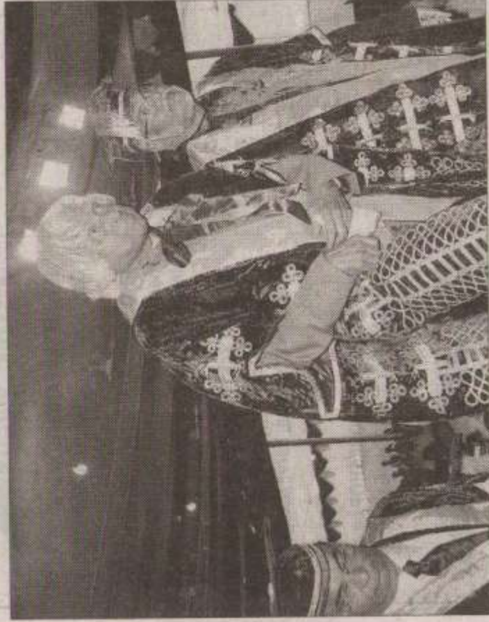
Kalam at the convocation of DY Patil Vidyapeeth in Pune on Friday