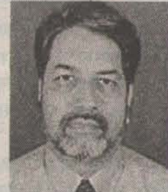
कुलगुरुकडे सुपूर्त करणार आहेत.